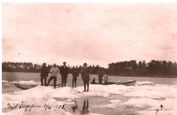
Drivande is i Tuppviken 1/6 1915.