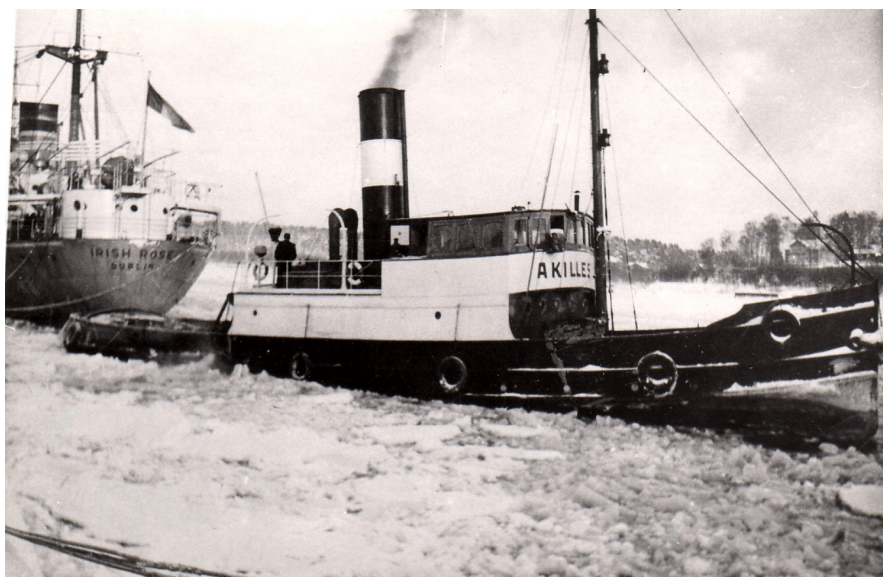
Bogserbåten STRÖMNÄS I senare omdöpt till AKILLES