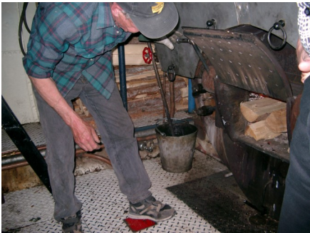
Eldaren fyller på ved.