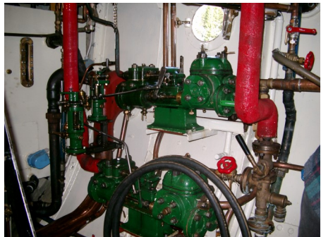
Del av maskineriet.