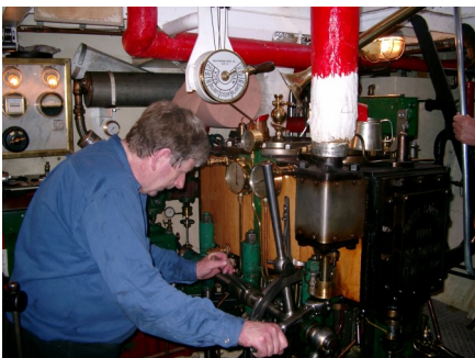
Maskinisten justerar ångtrycket