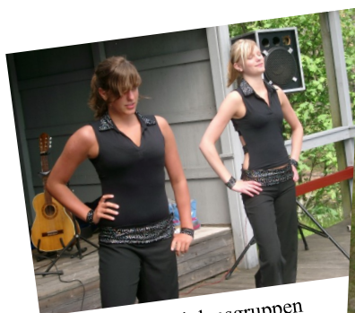
TVå medlemmar i dansgruppen Liqvido