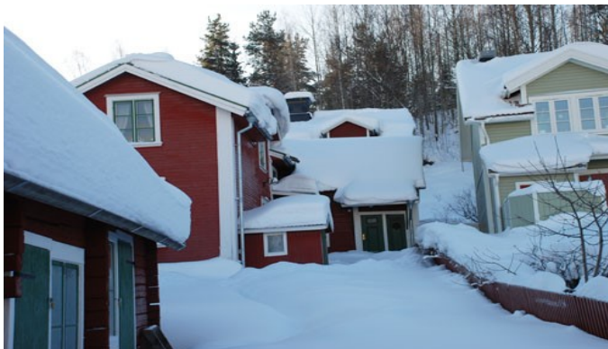
Fiskaremuséet i vinterskrud!

Besök vår hemsida för aktuell information om vår Kust & Skärgård ! www.skargardsforeningen.se