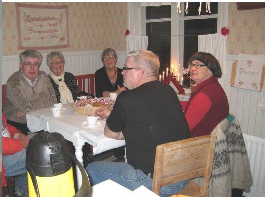
En glimt (nedan) från fikabordet.