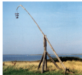
Vippfyr, Kovik, Gotland

Det handlade också om hur tekniken förändrats för att få fram ljus som kan leda sjöfarten i mörker och främmande farvatten. Det har funnits enkla vippfyror, där man eldade i en korg som hissades upp på en stång. Lite bättre var öppna koleldade fyrornas. Sen gick utvecklingen vidare med oljelampor och gasljus, som senare förstärktes av speglar och glaslinser. I AGA-ljuset som uppfanns 1906 användes Daléns nyuppfunna klippapparat. Att fyrar skulle vara praktfulla byggnadsverk, var heller inte oväsentligt, fick vi lära oss.