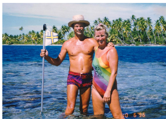
T.h. en söderhavsö får stifta bekant-skap med klubb-vimpeln, SÖSS.