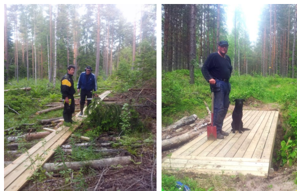
Ny informationstavla. Spångar och bro har anlagts efter ny sträckning till Palmängstorpet, (nr 6 på kartan).

Under senare år har det varit en hel del skogsavverkningar på Stålnäset. En del vandringsleder har måst läggas om. I dagarna har de nya sträckningarna blivit klara. Det återstår fortfarande mycket att göra men nu går