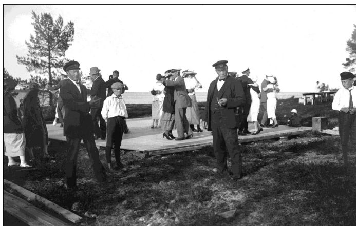
Dansbanan verkar vara det mest angelägna när Söderhamns Motorsällskap etablerade sig på Orn. Inte heller här vet vi något om personerna på bilden, årtal eller fotograf.