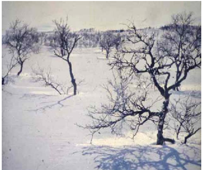
Silverbjörkarna uppe vid Kalvpannan. En märklig och kortvarig upplevelse