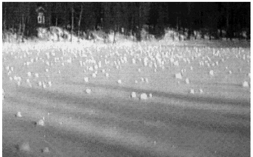
Snöbollarna på Kiialatjärn. Bilden är skannad från en utskrift, därav kvalitén. Att få uppleva detta är få förunnat.. Bilden nedan . Om man har tur att komma upp på fjället dygnet efter den första frosten kan man få se dessa färger.