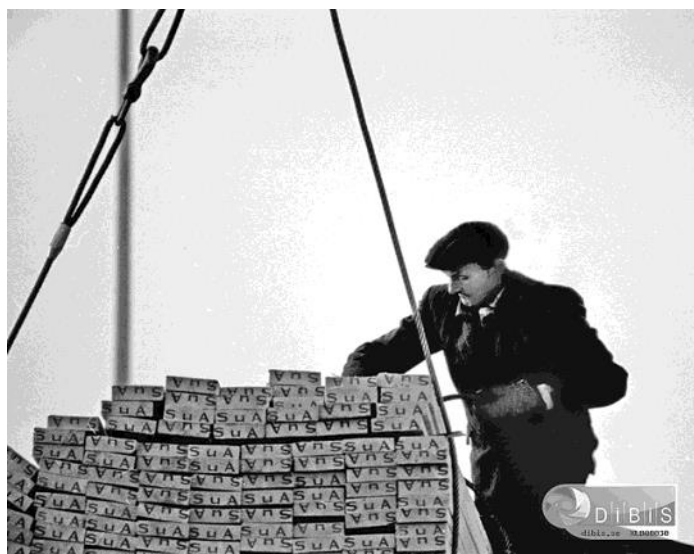
Stuveriarbetare gör iordning ett virkeslyft. Inga inplastade virkespaket här inte. Skyddsutrustning, handskar.