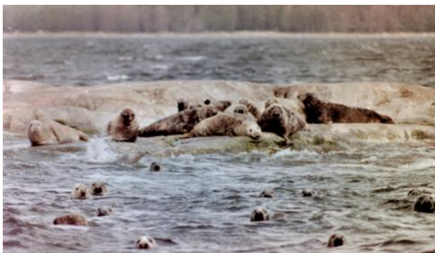
Sälarna på Tihällan