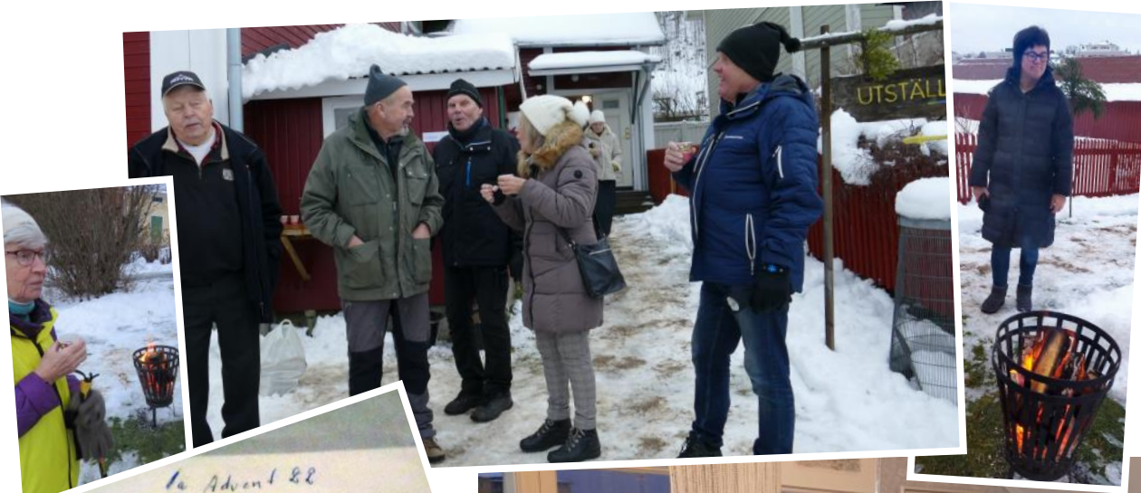
Glögg och värmande eldkorgar på tunet... eller kanske "skvallertor get"...

Adventskaffet är väl den mesta traditionen i Skärgårdsföreningens historia. Första advent med julskyltning och julmarknader på stan. Fiskaremuseet som träffpunkt har varit legio, där stugvärmn höjer mysnivån och julstämningen. Många kom som synes även i år och fikade, tittade på utställningar och bilder och köpte lotter och böcker. Ute bidrog även snön till julstämningen där besökarna värmdes sig med glögg och brasa på tunet.