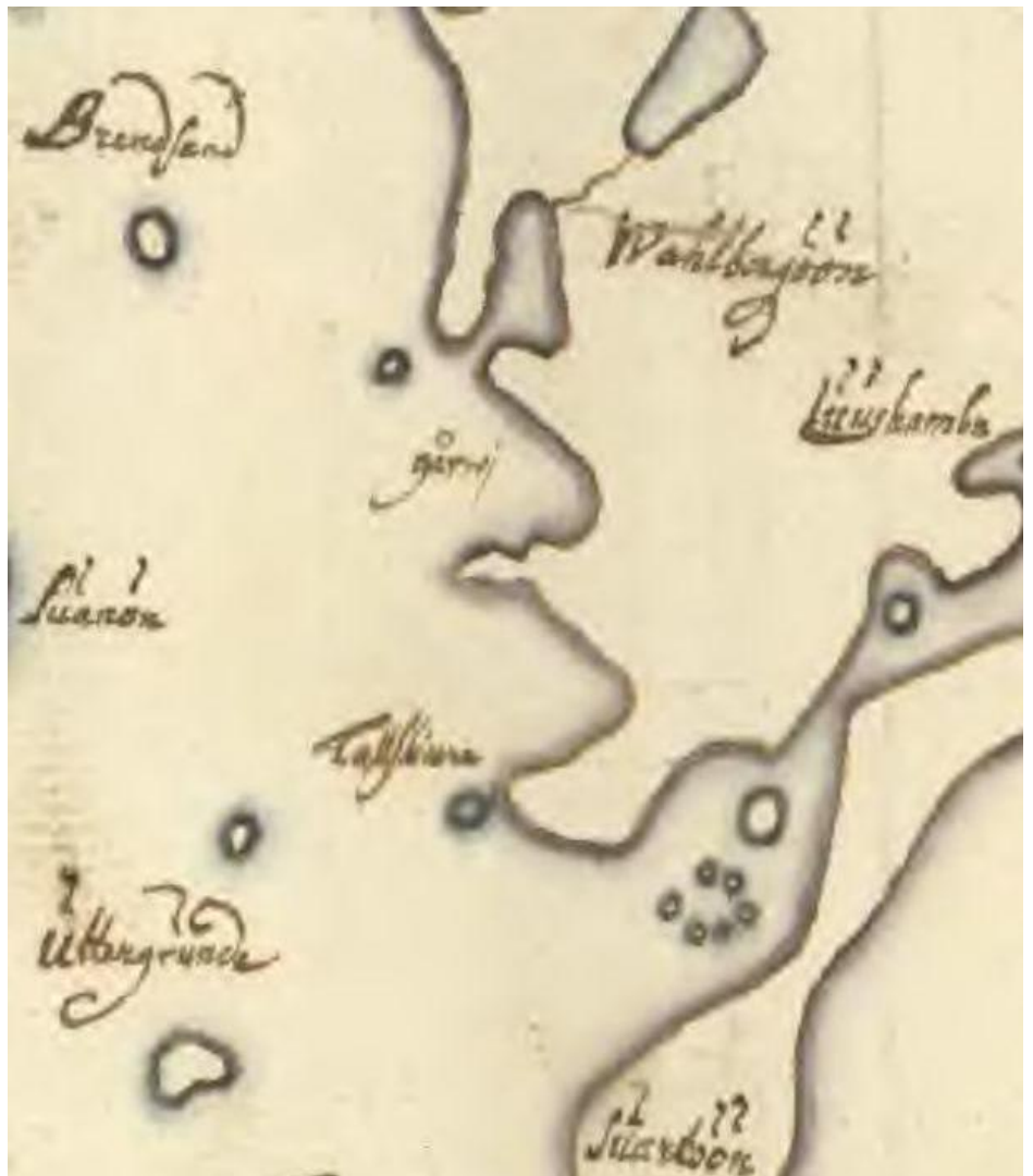
Karta från 1698. Det är inte så lätt att känna igen sig först, särskilt som väderstrecken är ovan placerade med väster ’uppåt’ och norr ’åt höger’ på bilden. Längst ner finns Skatön, som till relativt nyligen hette Svartön (jfr Svartsundet).

Trots att namnet inte tycks vara så allmänt använt har det gamla anor. Visserligen finns inte viken nämnd i Börjesson Gaddss karta från 1650, som är ganska rudimentär – inga vikar i närområdet finns ens utritade. Gårwij(k) finns däremot med på en skärgårdskarta från 1698 (se bild), men då gäller det viken bredvid, västerut. Möjligen är det detta som senare lett till en tolkning att viken/vikarna väster om (det som numera kallas) Långudden heter Lill-Gårvik och den vik som ligger innanför segelsällskapets område följaktligen heter Storgårvik (så benämns de i den ekonomiska kartan från slutet av 1950-talet). På Lindenborgs karta från 1747 är verkligen Storgårwiken utsatt, men någon mindre vik med samma namn finner man inte. Samma sak gäller Wermings karta från 1811, som är betydligt bättre än de äldre när det gäller själva hantverket. På båda dessa kartor är det för övrigt intressant att notera att det som där kallas Tallskär (som vi nu kallar Långudden) ännu var en ö och att Storgårwiken således sträckte sig över två vikar.