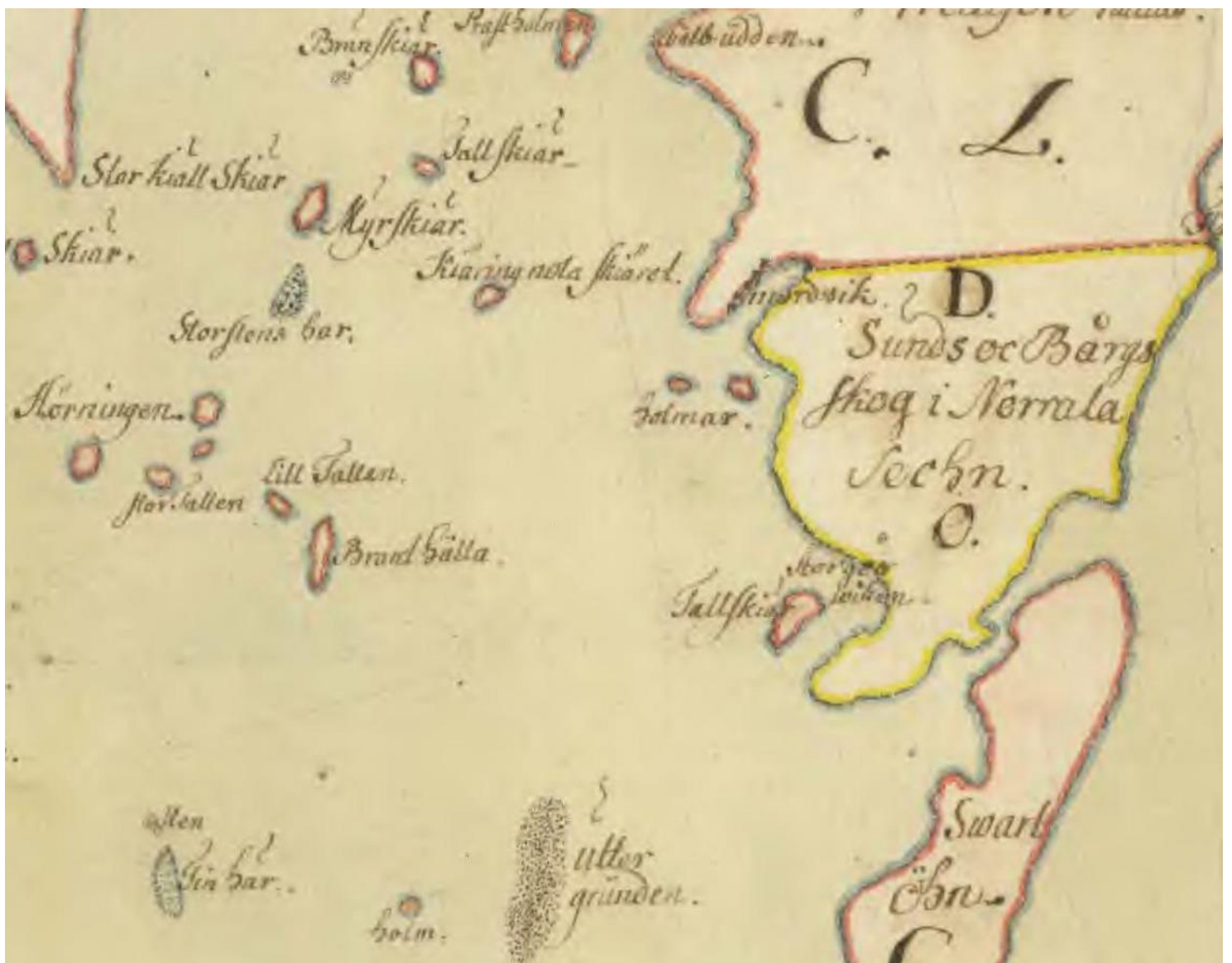
En liten del av Lindenborgs karta från 1747. Storgårdsviken gömmer sig innanför ön Tallskär, som troligen är det vi idag kallar Långudden.

framstår särskilt tydligt, så här långt senare. Men av historiska skäl brukar vi ju hålla fast vid gamla namn och att bemärkt ihop med att kalla segelsällskapets vackra udde för Segelvik.