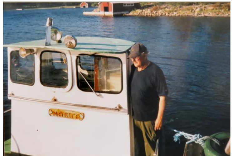
Sölve vid styrhytten med namnet "MARITA" fint utsirat på namnbrädan.