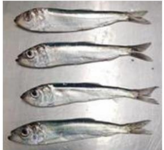
Mager strömming från provfiske i södra Bottenhavet (Med tillstånd av Jari Raitaniemi)

Bilderna ovan är lånade ur Länsstyrelsens broschyr: "Strömmingen behöver akut hjälp".