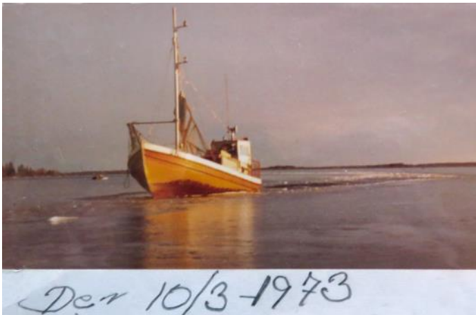
Isbrytning till Långudden. (Innan den nya styrhytten är byggd.)