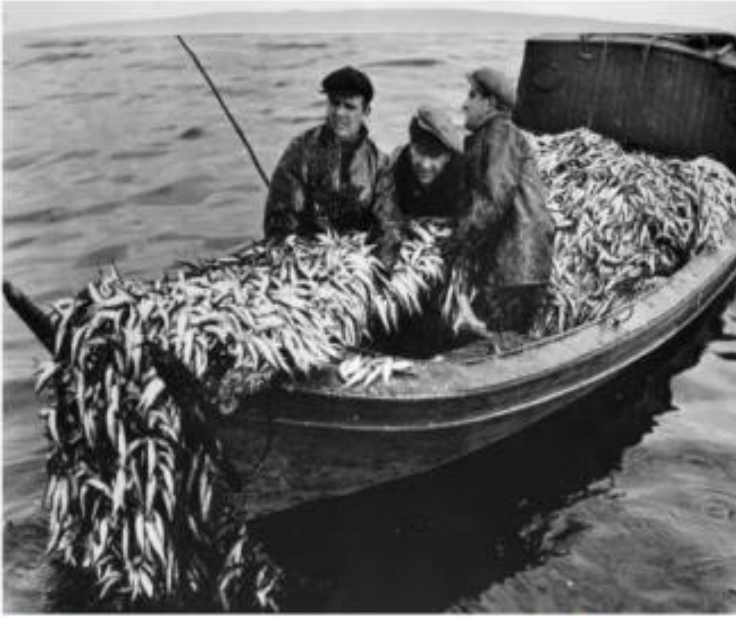
Kustnära fiske då strömmingen fanns i överflöd

ket som kommit allt närmare kusterna i Hälsingland och Gästrikland.