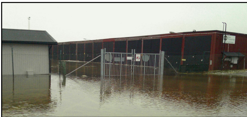
SMS vid högvattnet 9 dec. 2011.

(Fortsättning om barkskeppet Blenda från Söderhamn följer.)