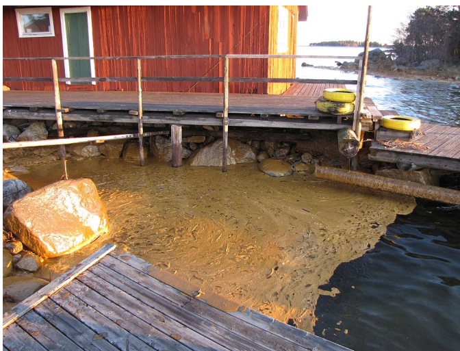
27 dec. Morviksharet. Kan man lägga ekan här till våren, måntro och vem tvättar stenar och bryggor?

bra bit på stranden, så att den också täckte stora stenar och gräset var klabbigt.