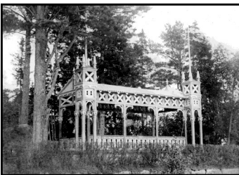
Det originella lusthuset/paviljongen på Tuppen, byggd på 1880-talet.