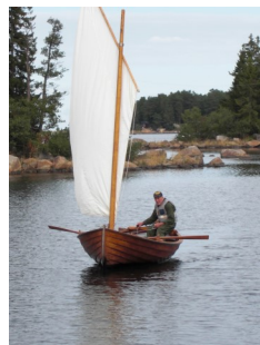
30 år med vind i seglen