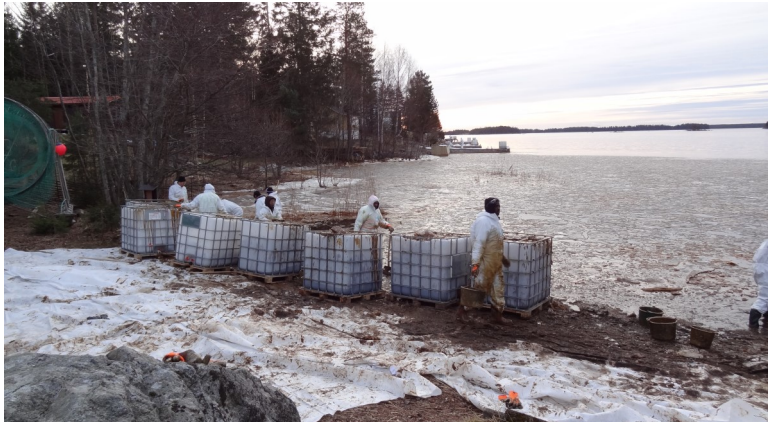
28 dec. Sanering på Långudden. Uppsamlingskärl har placerats ut på stränder och bryggor, som är i full färd att fyllas av arbetsstyrkan.

varje enskild målsägare själv kräva av Arizona. Ska man ha någon framgång i en skadeståndsprocess behöver man ha bra påfötterna och det kan kommunen hjälpa till med. Det är viktigt att man inte sannerar själv