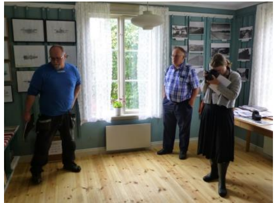
Representanter för Perex Bygg AB, Kust & Skärgård och Läns museet synar det nya golvet.

Källaren under utställningslokalen synas.