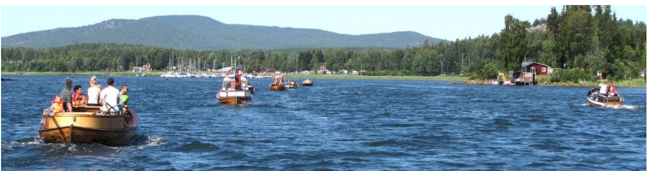
Träbåtsarmadan på väg in mot Borka brygga den 12 juli 2014.