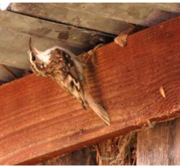
Trädkryparen vid sitt kryphål.

Nu gläds man mest åt alla fåglar. De kollade jag inte så noga på som liten. Staren har kommit till en av holkarna igen efter flera års frånvaro. Ejderhonan var tidig, mitt på holmen låg hon, så att man höll på att kliva på henne. Det blev fyra ungar efter 25-30 dygn. Strandskatorna fina att se på och för första gången en trädkrypare, som hittat ett kryp-