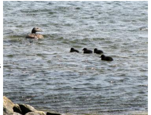
Ådan med sina fyra nykläckta ungar, vid stranden utanför stugan, den 5 juni.