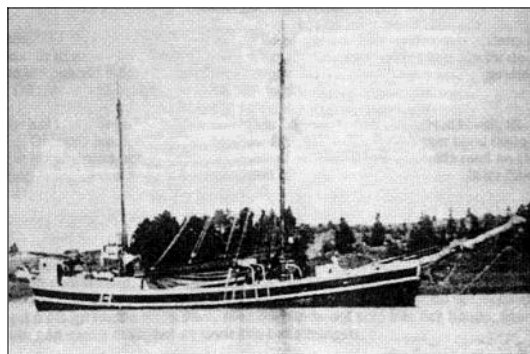
Galeasen "Alf av Blidö" från "Görans dykhörna".

På juldagen inforslades de med bilar till staden. De flesta tycktes ha kommit ifrån kallbaden utan några men, utom andre styrmannen på tyska ångaren, som på grund av den dåliga fotbeklädningen han hade, under vandringen över Bålsön fått fötterna förfrusna och därför måst läggas in på Hudiksvalls lasarett..... Styrmannen får bereda sig på minst en månads sjukhusvistelse."