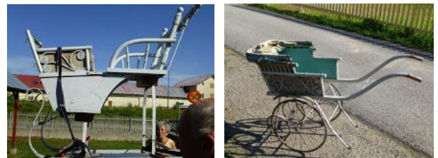
Vi har fått många gåvor. Här ser vi en sparkstötting med plats för 2 barn, och en barnvagn. Detta har vi fått av Anneli Nillbrand och hennes familj + en sockertopp med tång!