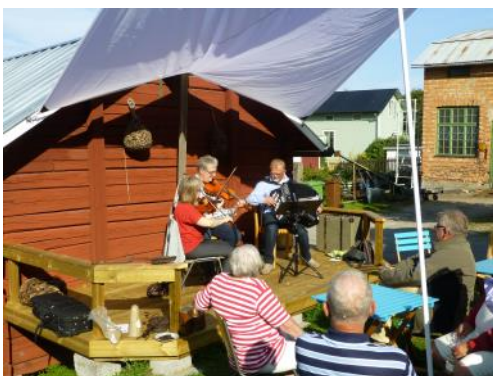
Solig musikunderhållning från den nya ändamålsenliga scenen.