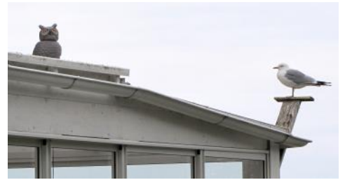
Ugglan tänkt att avskräcka kackande måsar.