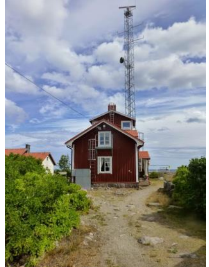
Lotsstugan som den såg ut 1923 och Lotsstugan idag 2014.